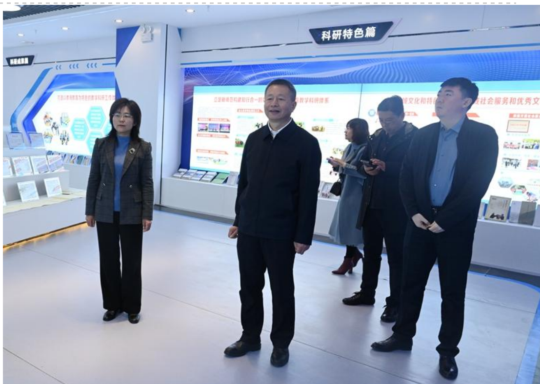
参观教学科研成果展馆