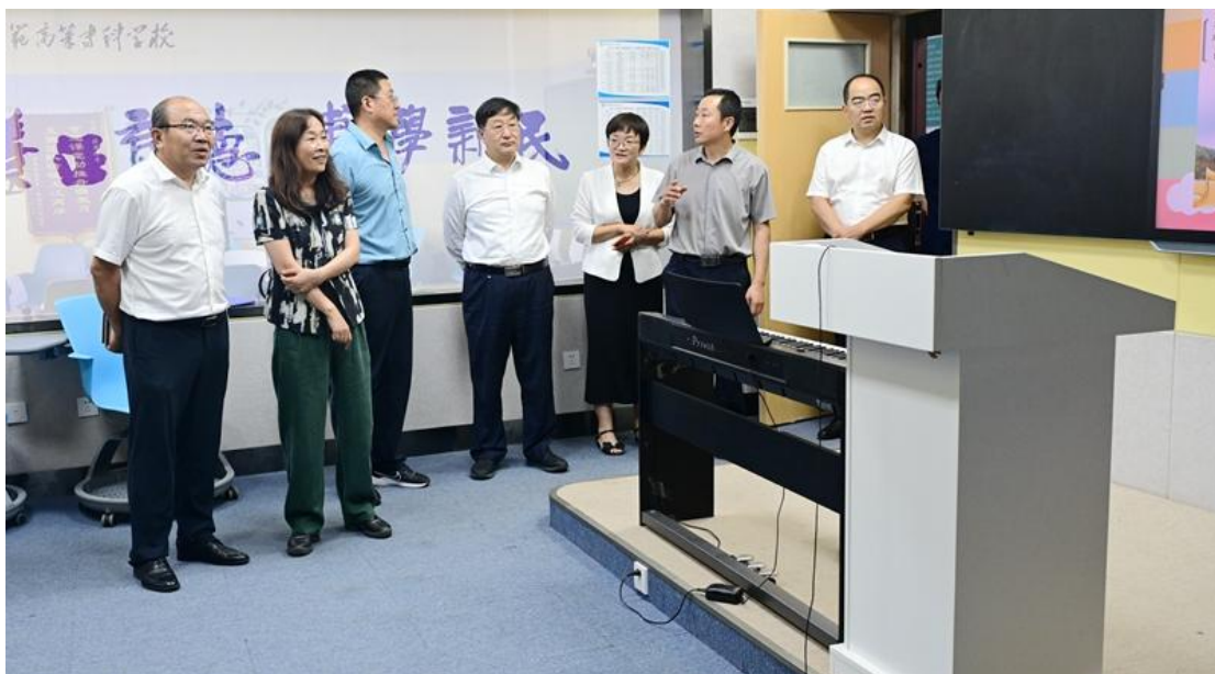
参观互联网+支教教室