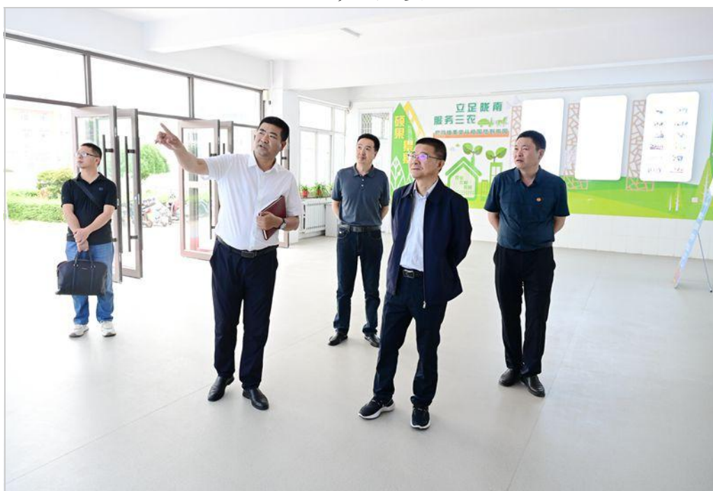
参观农林技术学院