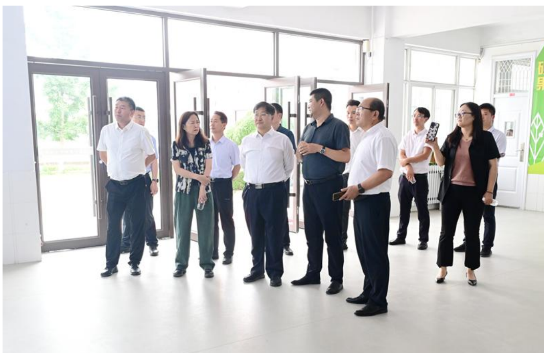
参观农林技术学院